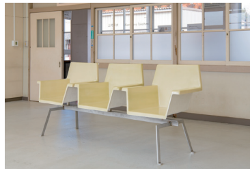
《KMC_001 (mind set)》2024年 FRP、ステンレス、塗料 H960×W2370×D645 mm