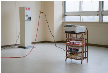
(手前)《portal》2024年 ファクス(NTTFAX T-360)、電話回線、感熱紙 サイズ可変 (奥)《[ex] change》2024年 両替機(BOSTEC BX-102、架台)、百円硬貨 H1350×W460×D450 mm

1980年高知県生まれ、福岡県在住。2005年武蔵野美術大学大学院造形研究科美術専攻彫刻コース修了。2008年同大学院博士後期課程単位取得退学。主な展覧会に、2025年個展「見えているものと食べたらなくなるもの」art space tetra(福岡)、「瀬戸内国際芸術祭2025『瀬居島プロジェクト SAY YES』」旧瀬居島中学校(香川)、2024年「福岡アジア美術館アーティスト・イン・レジデンスの成果展 周縁からはじまる」Artist Cafe Fukuoka(福岡)、2020年「発生の間」佐賀大学美術館、2018年「スーパーローカルマーケット」九州芸文館(福岡)、2014年「Under 35 上村卓大展」BankART Studio NYK(神奈川)、2009年「変成態ーリアルな現代の物質性 vol. 3 泉孝昭 × 上村卓大 | 『のようなもの』の生成」gallery αM(東京)、2007年個展「夜景と食卓」村松画廊(東京)、2006年個展「いいなづけ」(同)、2005年個展「TOWN WORK」(同)がある。