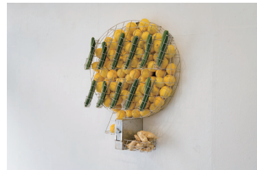
《honesty box (cucumber ginger lemonade)》2025年 | ステンレス、コインセ レクター、胡瓜、生姜、レモン H785×W720×D195 mm

■取材、掲載用写真の貸出など、ご質問がございましたら下記までお問い合わせください。■